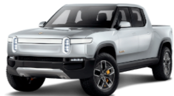
Rivian R1T $72,900 270-420 miles