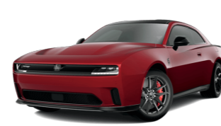
Dodge Charger $59,595 241-270 miles