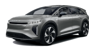
Lucid Gravity $79,900 301-450 miles

Descubre más vehículos eléctricos en PlugStar.com