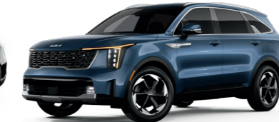
Kia Sorento $48,290 31 / 440 electric total miles