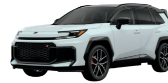
Toyota RAV4 Plug-In Hybrid $44,815 52 / 600 electric total miles