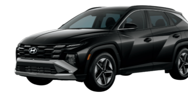
Hyundai Tucson $40,325 32 / 420 electric total miles