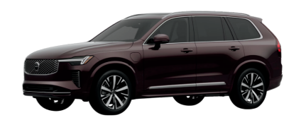
Volvo XC90 Plug-In Hybrid $77,595 32 / 530 electric total miles

Encuentra más híbridos enchufables en PlugStar.com