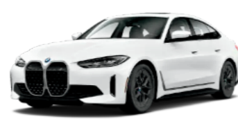
BMW i4 $57,900 232-333 miles