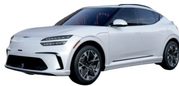
Genesis GV60 $52,525 252-306 miles