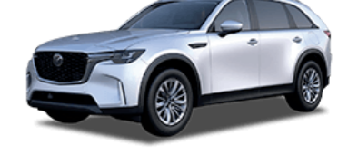
Mazda CX-90 $50,495 27 / 500 electric total miles