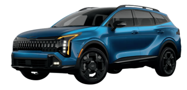
Kia Sportage Plug-In Hybrid $40,490 34 / 470 electric total miles