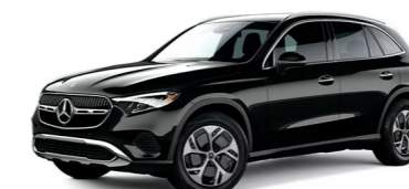
Mercedes-Benz GLC 350e $60,300 54 / 380 electric total miles