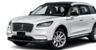
Lincoln Corsair Grand Touring $54,365 27 / 450 electric total miles