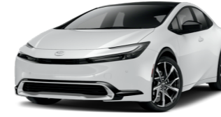
Toyota Prius Plug-In Hybrid $33,775 44 / 600 electric total miles