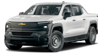
Chevrolet Silverado EV $55,895 283-478 miles