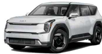
Kia EV9 $54,900 230-305 miles