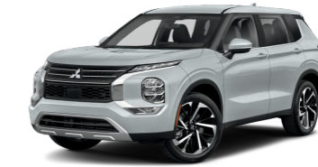
Mitsubishi Outlander $40,445 38 / 420 electric total miles