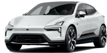
Polestar 4 $56,400 280-310 miles