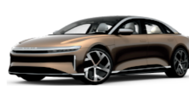
Lucid Air $70,900 420-512 miles