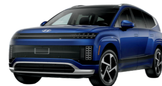
Hyundai Ioniq 9 $58,995 311-335 miles