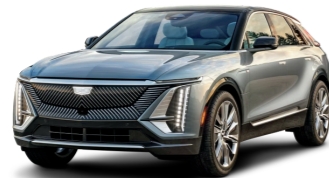
Cadillac LYRIQ $59,200 285-326 miles