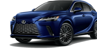
Lexus RX 450h+ $65,230 38 / 540 electric total miles