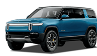
Rivian R1S $76,990 270-410 miles