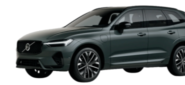
Volvo XC60 Plug-In Hybrid $62,545 35 / 560 electric total miles